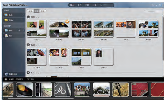
▲ 不管開啟哪個程式，首頁的介面是完全一模一樣的！

Corel 在設計影音寶典程式前，曾經調查客戶對於軟體使用的需求：「普通數位媒體消費者比較忙，沒有時間，也不想精通複雜的軟體應用程式…」，所以，「簡潔、乾脆、不囉嗦！」這是瀟灑給影音寶典的七個字。在軟體介面中，沒有過多的按鍵指令，完全抓住數位生活核心。利用整合性的介面操作，一次學會四套軟體五大功能的使用，達成「消費者希望快速、輕鬆地製作和分享令人驚嘆的專案。」