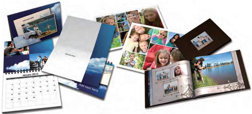
▲ 卡片、相簿、月曆、多圖拼貼，愛怎麼玩就怎麼玩

各式各樣的專案作品製作是PaintShop Photo2010最精采、最貼心的功能，幾乎將影像素材運用到極致。從相簿、卡片、月曆到多圖拼貼、電子相簿...等，讓照片不再只是單純的數位檔案，而是實體的作品。這可是必修課程，缺課的同學我一定要當啦！