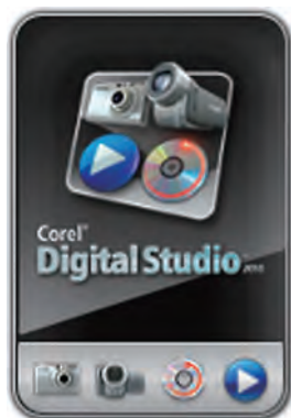
Corel Digital Studio Gadget 2010