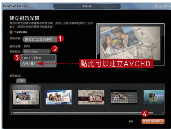
▲ 專案名稱設定為：練習DVD影片製作。