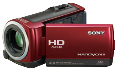
▲ 目前新型攝影機都支援AVCHD

AVCHD (Advanced Video Codec High Definition)，由Sony與Panasonic在2006年5月發表的高畫質光碟壓縮技術，這款技術讓我們透過一般的DVD光碟也能欣賞高畫質影片。目前能在PS3上播放AVCHD，電腦則必須透過支援AVCHD播放程式才能觀看（例如：Windvd）。