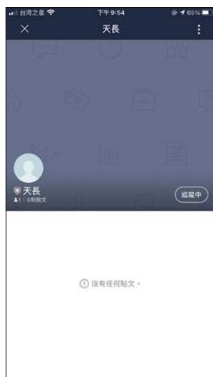
未設定封面照片時主頁呈現的畫面