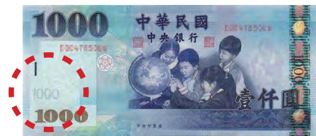
(D)1000 元 _____