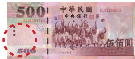
(C)500 元 _____