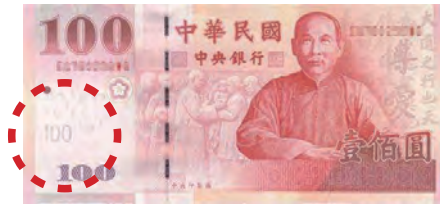
(A)100 元 _____

檢定問答題：請依各鈔票之迎光透視水印說明 100、200、500 及 1000 元之圖案為何。