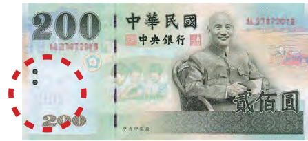
(B)200 元 _____