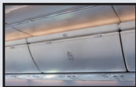
Overhead bin 頭頂上方置物櫃