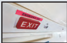
Emergency exit 逃生出口