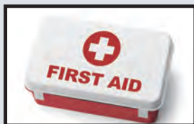
First aid kit 急救箱